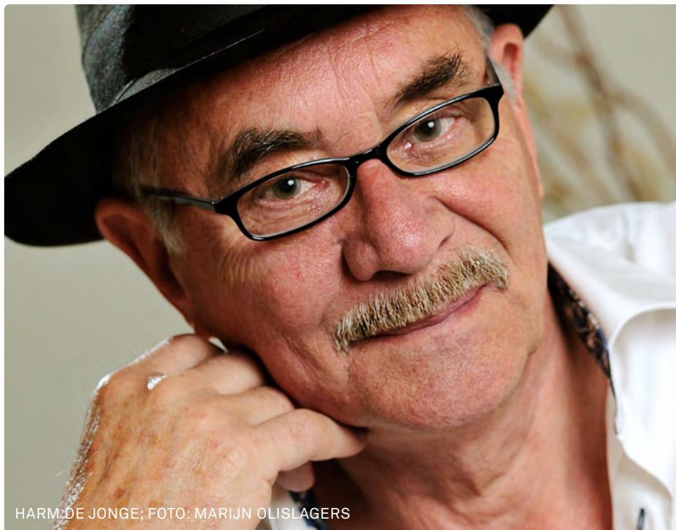
HARM DE JONGE

ven en inmiddels heeft hij een groot oeuvre van kinderboeken, zoals 'Het Peergeheim' en meer recent 'De Vogeltjesklok' en 'Josja Pruis' waarvoor hij de Woutertje Pieterjessprijs won. Voor het boek 'Vuurbom, de geschiedenis van een vriendschap' ontving Harm de Jonge in 2012 de Zilveren Griffel. In 2014 schreef hij het Kinderboekenweekgeschenk 'Zestig spiegels'.